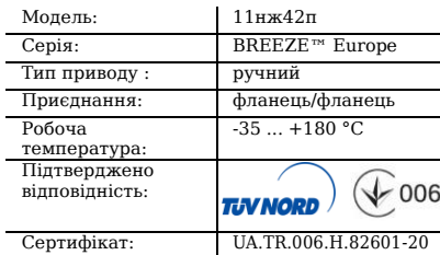
Таблиця 1. Характеристики