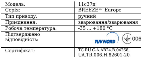
Таблиця 1. Характеристики

11c037п - кран кульовий запірний сталевий