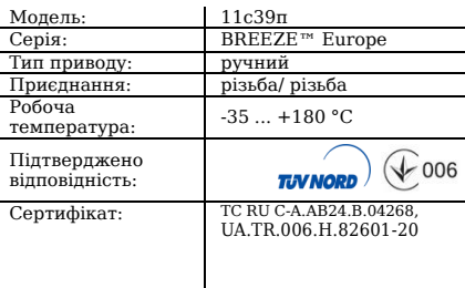
Таблиця 1. Характеристики