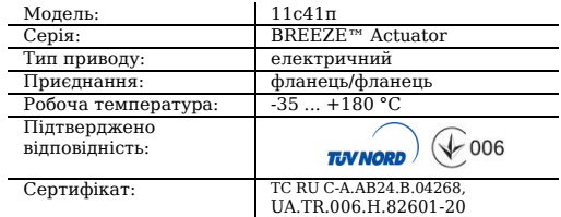
Таблиця 1. Характеристики